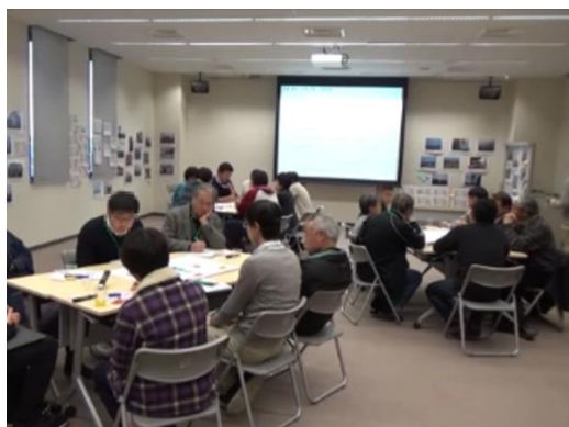
写真 12 グループトークの様子

前半の15分は「大間視察の様子を聞いて、何を感じたか」というテーマで、後半の15分は「私たちは原子力とどう付き合うか」というテーマで、話し合いが行われた。