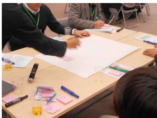
写真 14 グループトーク