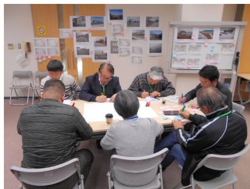
写真 13 グループトークの様子